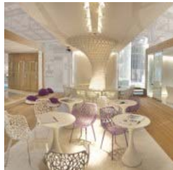
Στο lounge bar

Η αρχιτέκτονας Chiara Cantono οραματίστηκε το ξενοδοχείο του μέλλοντος σαν ένα ζωντανό οργανισμό που πάλλεται, αναπνέει, μεταβάλλεται, επικοινωνεί. Περιπατώντας κατά μήκος του διαδρόμου που οριοθετείται από φωσφορίζοντα διαχωριστικά κρόσσια, ο επισκέπτης φτάνει στο φουαγιέ. Η ρεσεψιόν είναι ατμοσφαιρικά φωτισμένη, ενώ το πλέγμα του φύλλου επικρατεί και πάλι ως μοτίβο. Καθαροί και στιβαροί, οι όγκοι των επίπλων παραπέμπουν σε περίτεχνα γλυπτά, ενώ το soundtrack του χώρου «υπογράφουν» χαλαρωτικές μελωδίες, συνοδεύει διάφορων ηχητικών και οπτικών εφέ. Η σειρά καναπέδων Ylo di Lamm, σε κυκλική φόρμα, έχει επιλεγεί για τους χώρους υποδοχής, καθώς τα καθίσματα ρυθμίζονται κατά μήκος και ύψος ανάλογα με τις εκάστοτε απαιτήσεις.